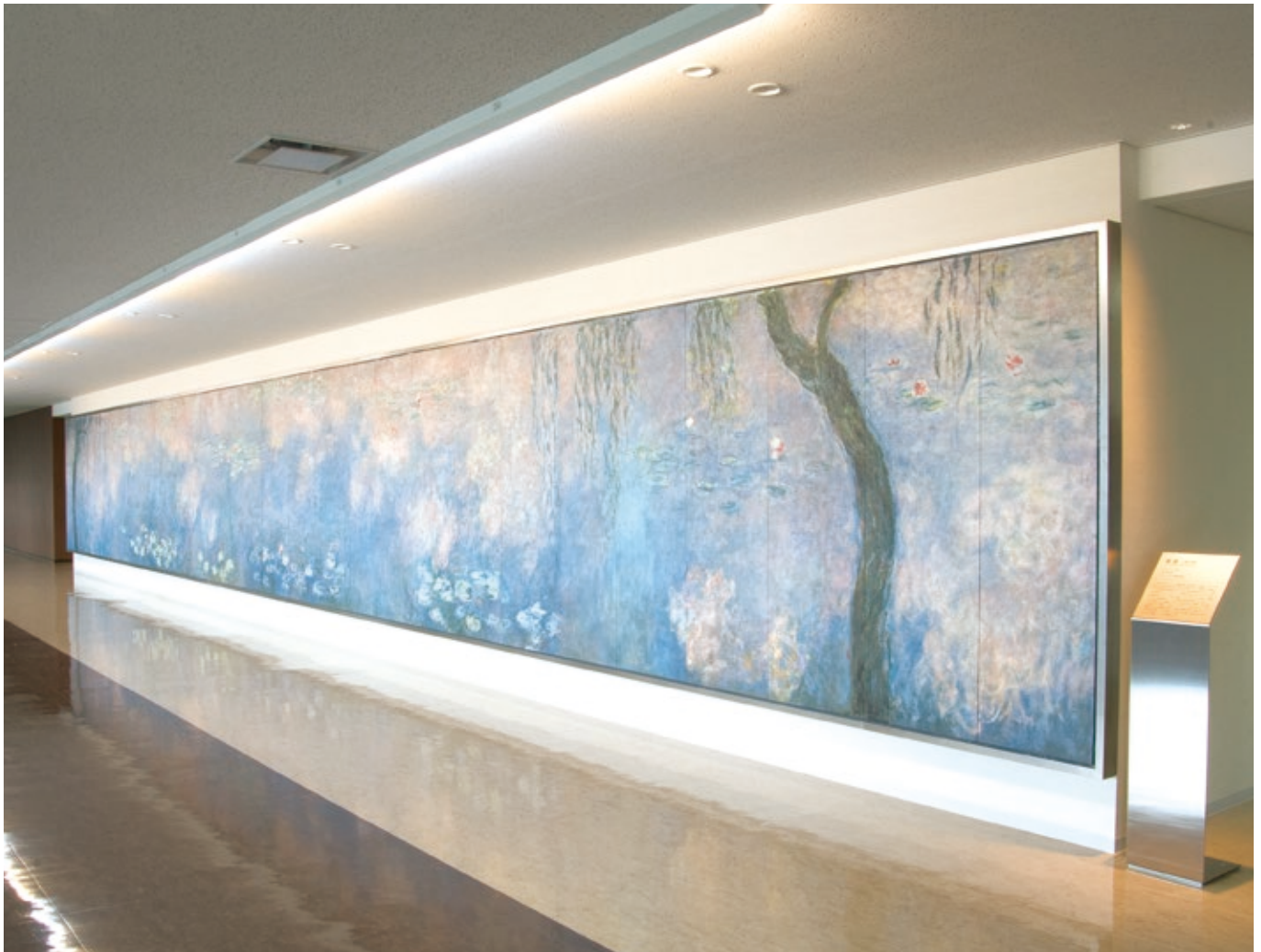
枚方学舎医学部棟3階に掛かる、クロード・モネ《睡蓮》の原寸大陶板画。