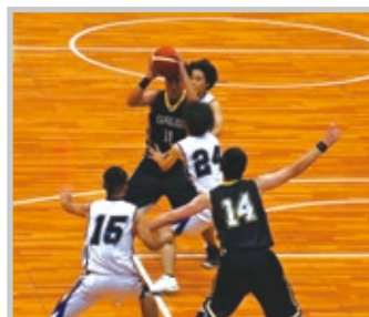
バスケットボール部(男子) 1回戦