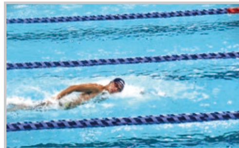
力強い泳ぎを見せる水泳部員