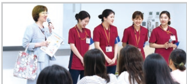
学生・教員によるキャンパスライフ説明

そして予約で満員となった人気プログラム「病院見学」では、附属病院の病棟や高度救命救急センターを見学。通常入ることのできないエリアも見学できる機会に、参加者は興味津々の様子でした。