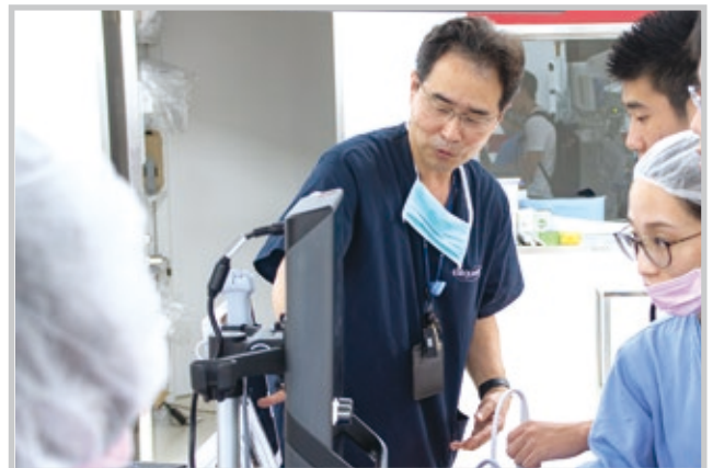
病院見学にて実際の機器を使用した体験の様子

「病院見学」では、附属病院の臨床検査部や中央手術部、健康科学センター、放射線部を見学。参加者からは担当教員の熱心な説明が好評でした。