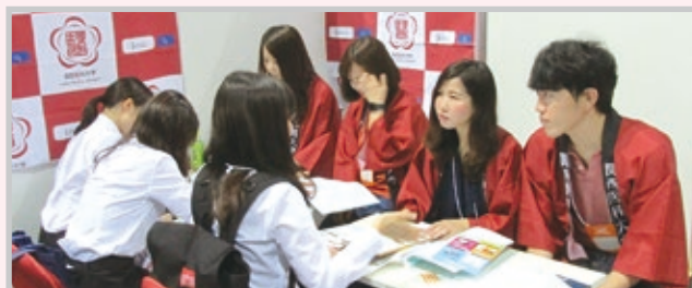
本学ブースの様子

7月7日(日)10時からインテックス大阪(大阪市住之江区)1・2号館において、「レジナビフェア2019大阪～臨床研修プログラム～」が開催され、本学もブースを開設しました。当日は約2,160名の来場者があり、本学のブースを訪れた142名に、本学の研修医7名が対応。終始和やかな雰囲気での話が進み、盛会裏に終わりました。