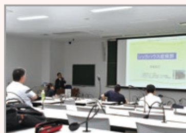
アレルギーセンターシックハウス勉強会