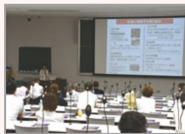
健康沿線®トークカフェ