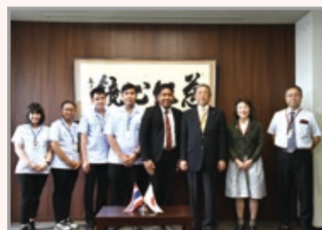
Princess of Naradhiwas University 留学生来学