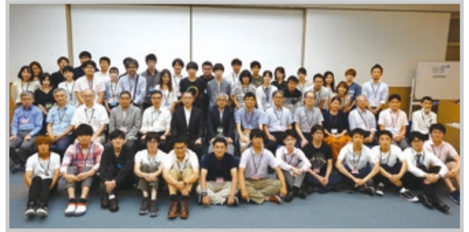
参加教員および学生ら