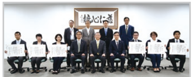
学位記を手に写真に納まる修了生ら