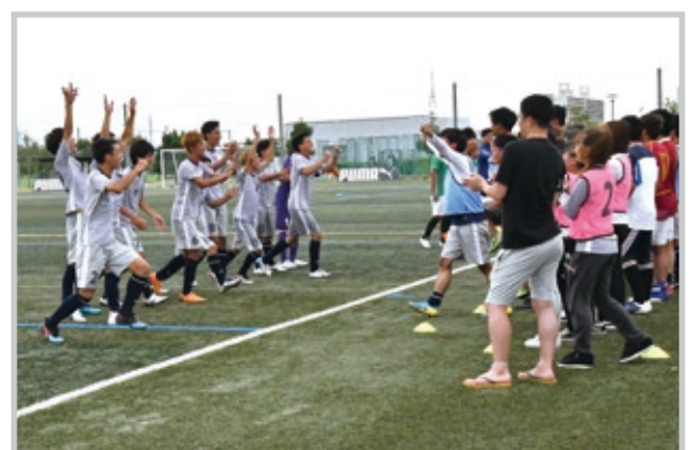
試合で勝利を決めたサッカー部