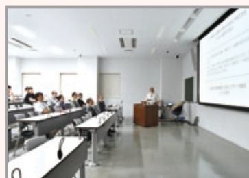
第2回大学院企画セミナー