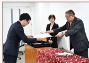
2019年9月度大学院学位記授与式