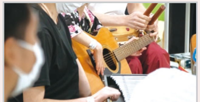
演奏する患児たち