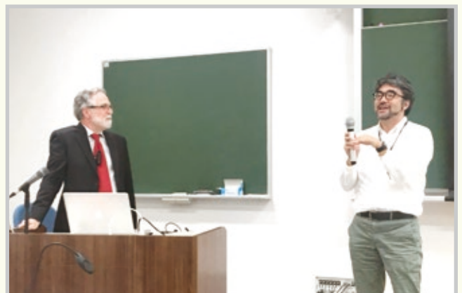
講演したグレッグ博士(左)と、司会を務めた廣田学長特命教授(右)

セメンザ博士からは最後に、「You are where I once was, I am where you will someday be.」とのメッセージが贈られました。