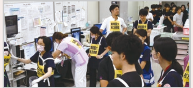
赤ゾーン(重症患者)の様子(右奥は見学する医学部生)

てお招きし、黒ゾーンの設営・受入れについての充実強化をはかりました。また初めての試みとして、大学での避難訓練終了後、授業の一環として、医学部・看護学部1~3年生は救命救急センター医師による災害に関する講義の受講、または「学生ボランティア」として災害訓練に参加。医学部4年生はグループに分かれ、附属病院の災害訓練の現場を間近に見学しました。