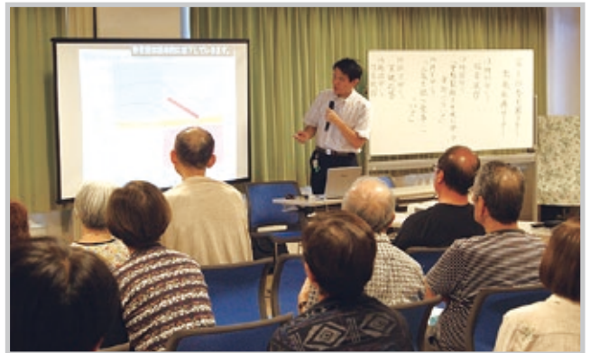
講演を行う整形外科上田部長(写真中央)

簡易判定を行ったところ、こちらも好評であり、多くの参加者から判定依頼がありました。