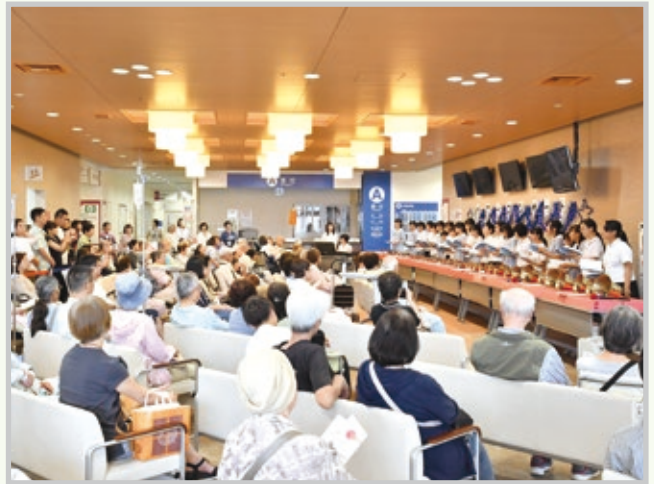
エントランスホールで催されたコンサートの様子

その後は合唱へ移り、「80年代メドレー」や「ほらね」「ヒカリノアトリエ」などを歌い上げ、ソロパートでは伸びやかな歌声に参加者は聞き入っていました。最後は「上を向いて歩こう」を全員で合唱し、盛況のうちに幕を閉じました。