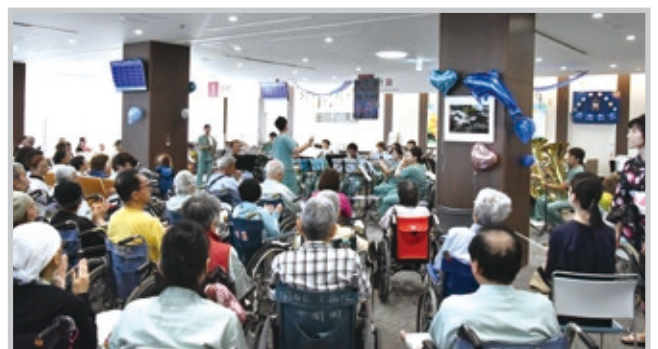
鶴見区音楽団(中央奥)による吹奏楽演奏