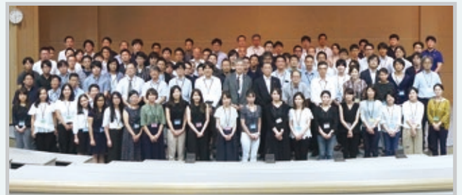
参加者による集合写真