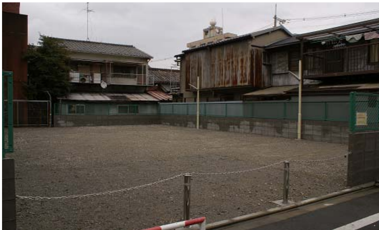
<登録医専用駐車場の外観>