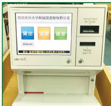
自動貸出返却装置

資料の貸出(延長)・返却の手続きは自動貸出返却装置、またはカウンターで行ってください。視聴覚資料の貸出はカウンターでのみ受け付けております。返却した資料は、カウンター横のブックトラックに置いてください。